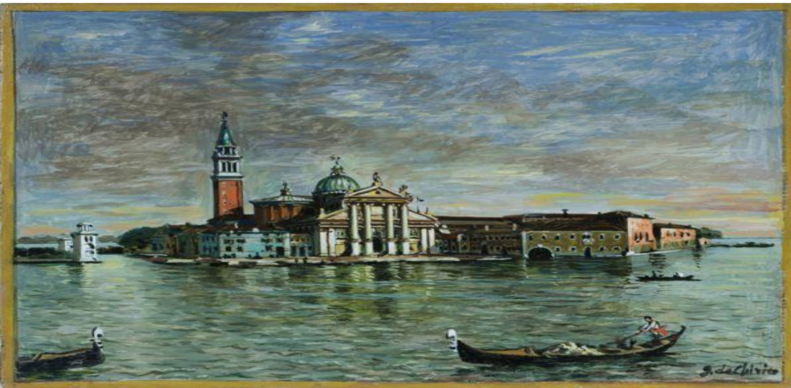
Isola di San Giorgio - Giorgio de Chirico 1956