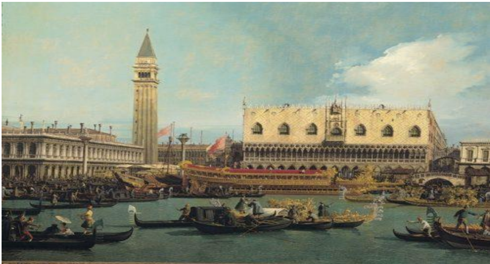
Canaletto - Il Bucintoro al Molo il giorno dell'Ascensione 1730