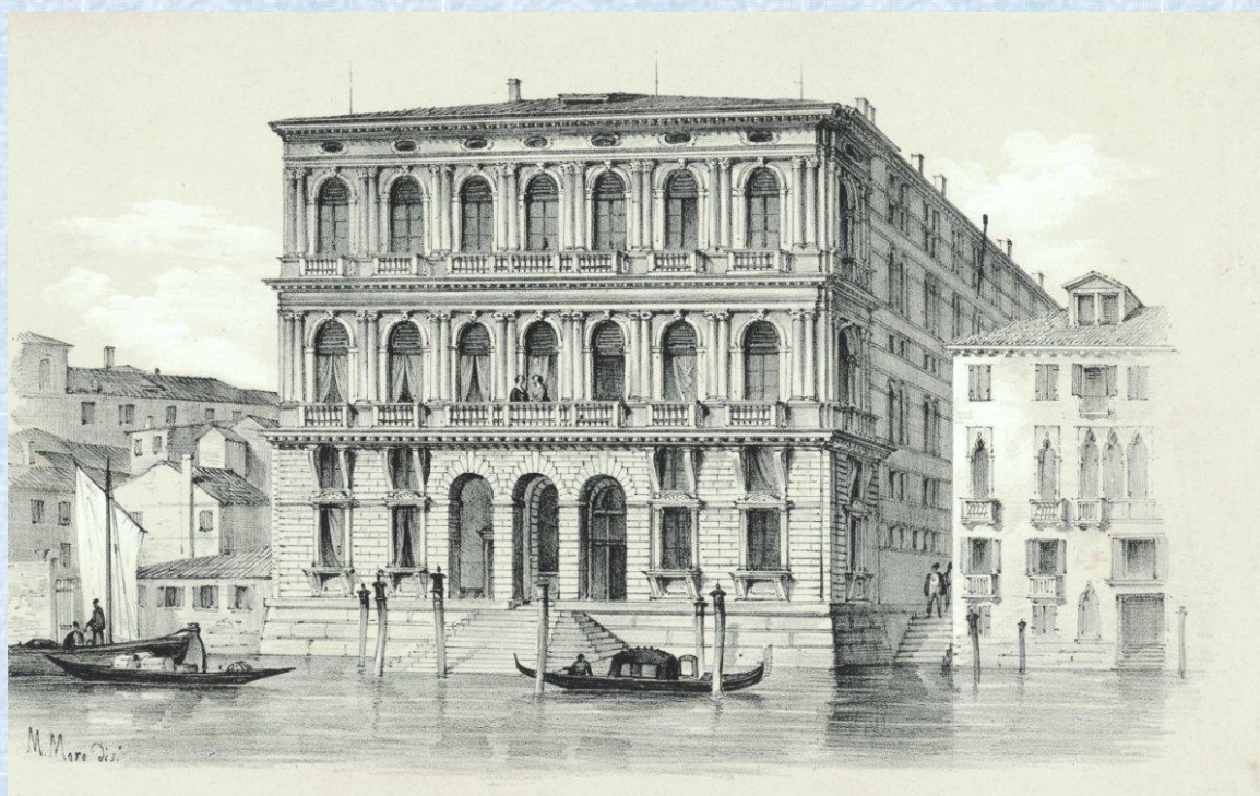
Palazzo Corner della Ca' Granda - Disegno di Marco Moro (1840 circa)

(ai sensi dell'art. 4bis del decreto legislativo 6 settembre 2011 n. 149)