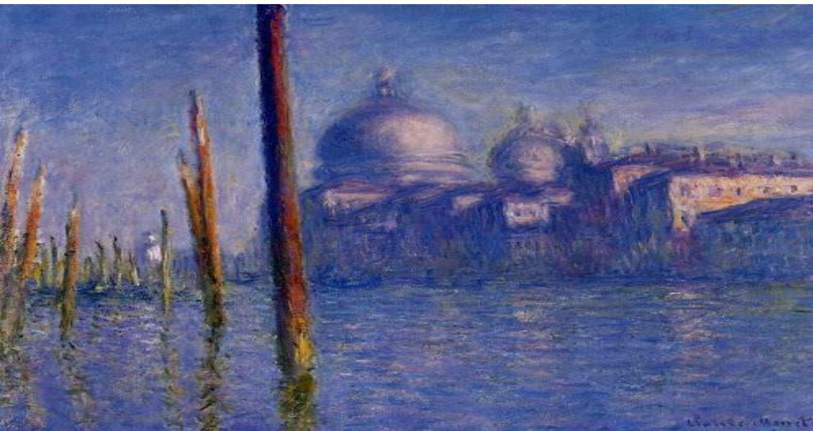
Claude Monet – Gran Canal, Venice 1908