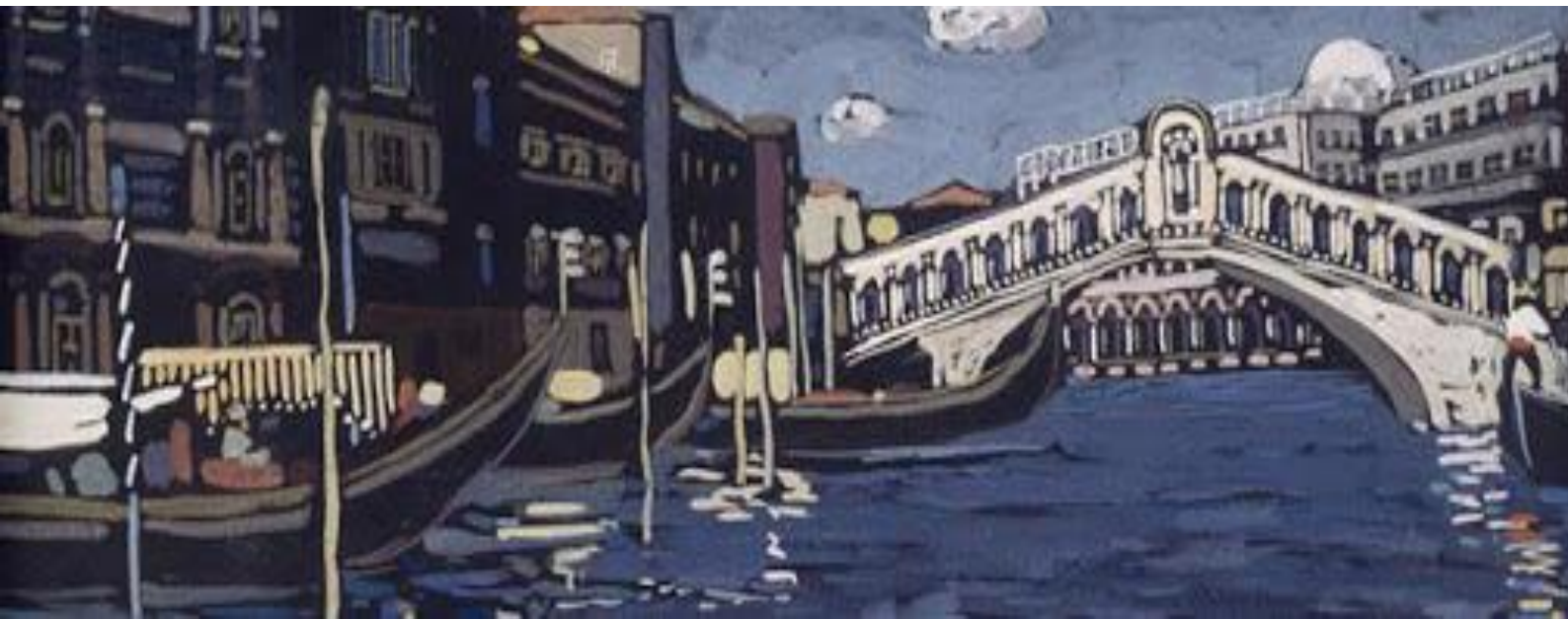
Vasilij Kandinskij - Venezia n.4 (1903)